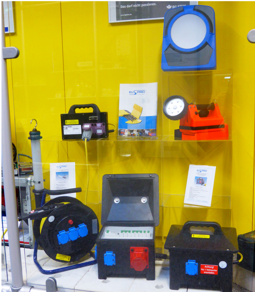
Ausstellungsvitrine in der Bildungsstätte der Berufsgenossenschaft Illertissen

Die ELSPRO Elektrotechnik GmbH & Co. KG, als langjähriger Partner der Berufsgenossenschaften, hat in der Berufsgenossenschaftlichen Bildungsstätte Süddeutschland e.V. in Illertissen einige ausgewählte Produkte ausgestellt.