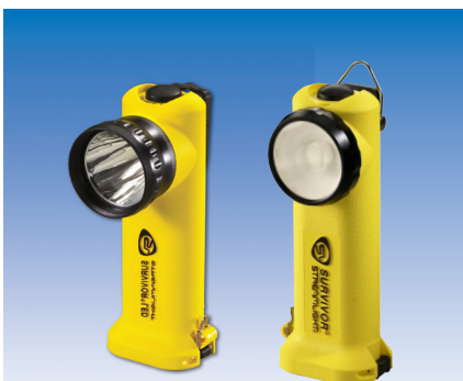
Modell bis 2014